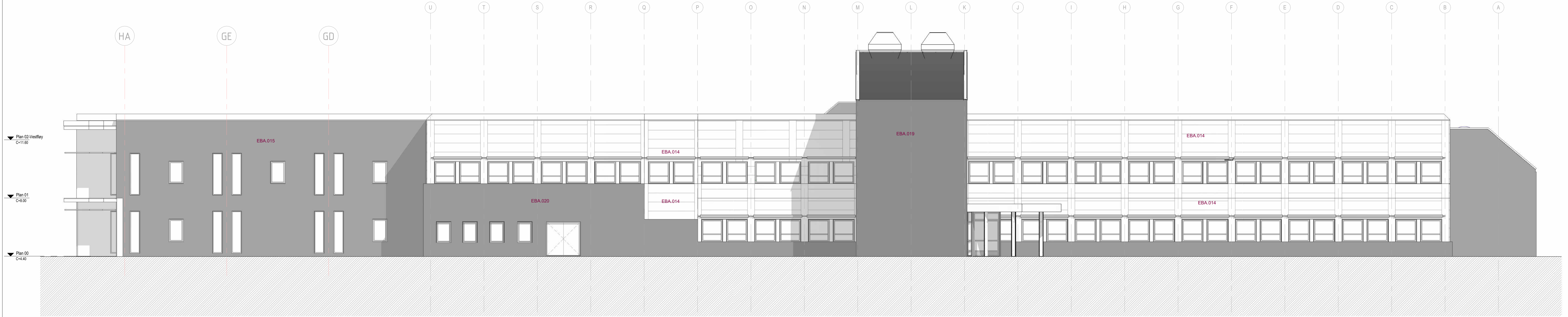
Fasade mot Øst 1 : 100

FASADER: Solavkløpning medtas på alle vinduer i begge etasjer, på fasader mot sør, vest og aust. Beskrivelse prosjekt: 12.237.3